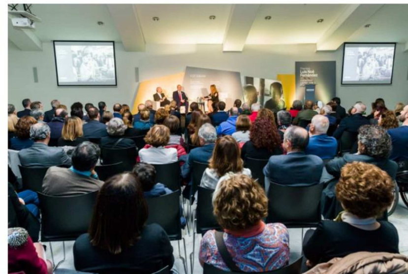
PYRANO y Peralta, premiados en anteriores ediciones, fueron recordados durante el acto de 2017.