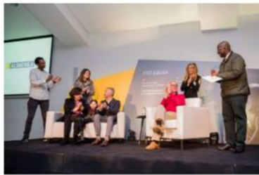
Cierre del acto de entrega de Premios.