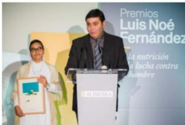
La ONGD Mediciu Mundi Asturias, premiada en la categoría de Lucha contra el Hambre en 2017.