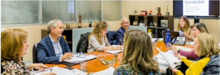
Reunión del Jurado de Nutrición en 2017.