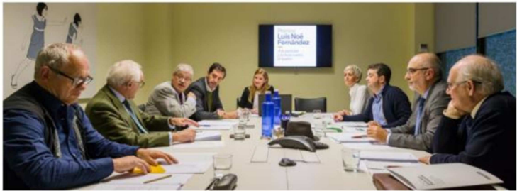
Reunión del Jurado de Lucha contra el Hambre en 2017.