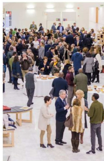
Acto de entrega de Premios, 2017

• Fundación Alimerka se exime de responsabilidad sobre cualquier uso que pueda hacer un tercero de las imágenes sin su consentimiento o fuera del ámbito territorial, material y temporal del presente acuerdo.