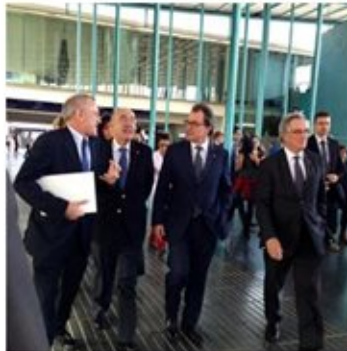
► Ampliar la imagen