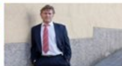
Dimissió a l'executiva del PP gironí per la corrupció i les «listes fantasma»