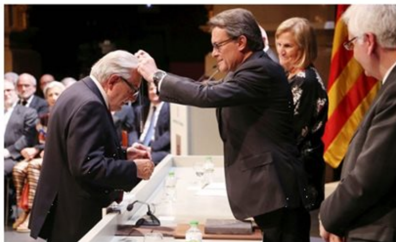
Artur Mas lliurant la Creu de Sant Jordi al metge Eudald Maideu.