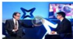
Mas avisa que els partits que facin pactes que obstrueixin el procés «pagaran el preu» el 27-S