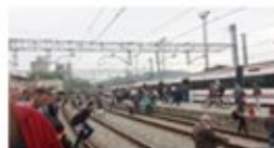
Caos a les línies 3 i 4 de Rodalies