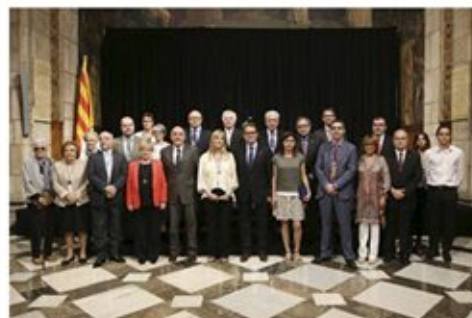
El president amb els guardonats amb les medalles i plaques Josep Trueta

▶ El cap de l'Executiu ha lliurat les medalles i plaques Josep Trueta a 13 professionals i tres entitats que han destacat pels serveis prestats en el progrés i millora de la sanitat