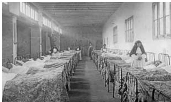
Les sales d'infecciosos , a primers del segle XX